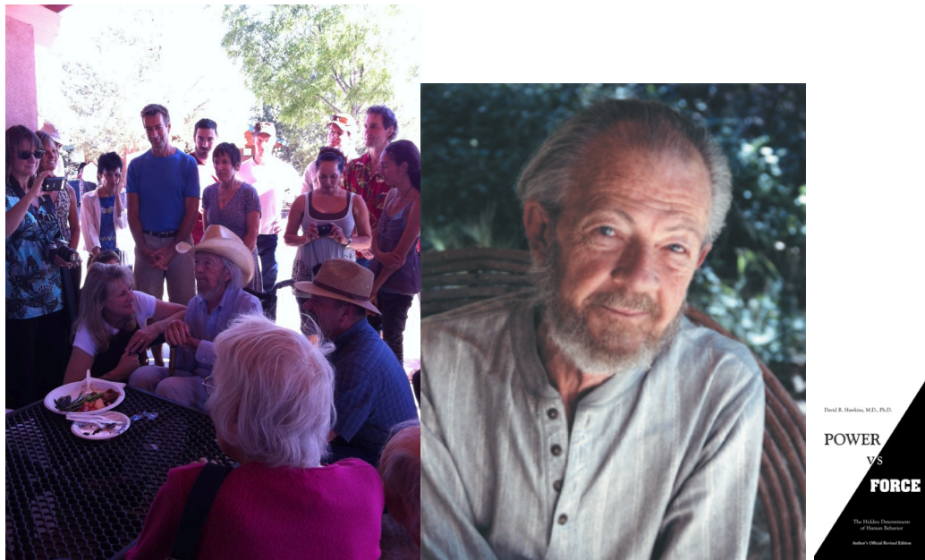
El Dr. Hawkins celebrando con los estudiantes su 85 cumpleaños. 9 de Junio de 2012.

Author's Official Revised Edition Power vs. Force, The Hidden Determinants of Human Behavior: An Anatomy of Consciousness by David R. Hawkins, M.D., Ph.D.